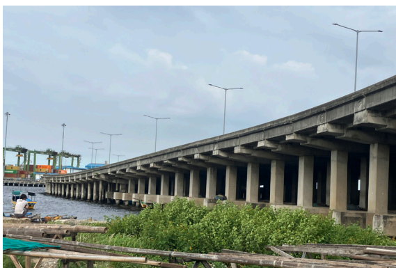
▲ 尼国のインフラ構造物

SHO-BOND & MITインフラメンテナンス株式会社(以下「当社」、ショーボンドホールディングス株式会社(以下「ショーボンド」))51%出資、三井物産株式会社(以下「三井物産」)49%出資)は、PT SMART INSPECTION INDONESIA社(以下「SII社」)と、インドネシア共和国(以下「尼国」)における事業連携の枠組を構築するための覚書(Memorandum of Understanding、以下「本MOU」)を締結しました。